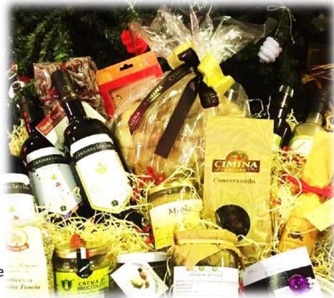
NCC6 Cesto cartone