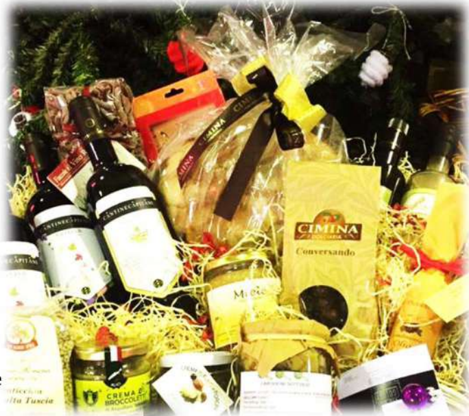
NCC6 Cesto cartone